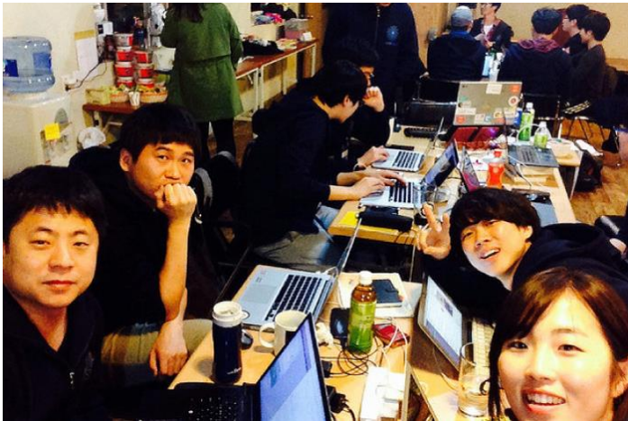
2014 해커톤을 가장한 코딩 MT