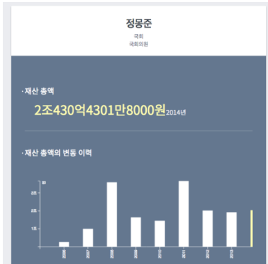
고위 공직자 재산 공개