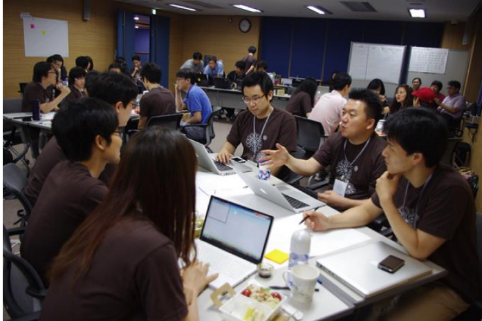
2012 공공데이터 캠프 / 2013 공공데이터 렛츠 & 캠프