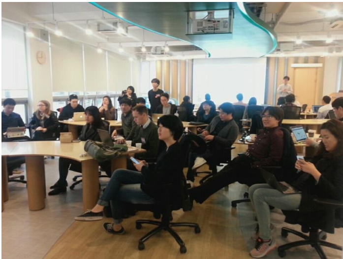
2016 CodeAcross & Open Data Day