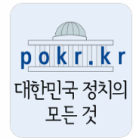
대한민국 정치의 모든 것