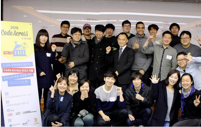
2015 CodeAcross: 지켜보고있다 대한민국 재정