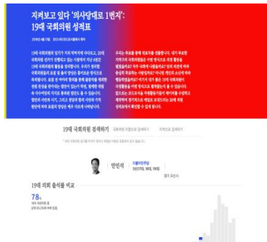
19대 국회의원 성적표